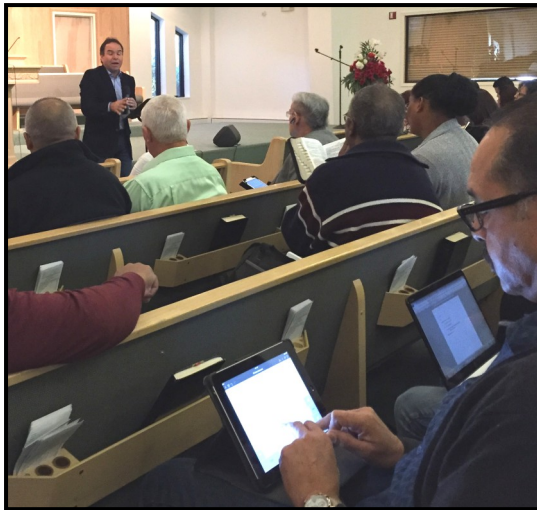
Alumnos toman notas del mensaje del Pr. Robert Amaya

estaba listo cuando llegaron los primeros alumnos de lugares tan distantes como Melbourne, y el distrito de Avon Park. Cuando el reloj marcó las 9:00 de la mañana, se escuchaban