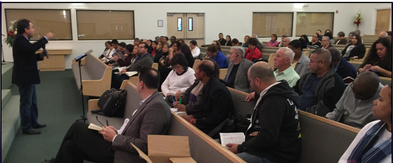
Alumnos del Área Central prestan atención a la enseñanza el domingo 8 de febrero en Winter Park

Según se nos ha informado, 128 alumnos han sido matriculados en el área Central y el número total de los matriculados en toda la asociación es de 415. Se espera que finalmente pasemos los 450. ¡Amén!