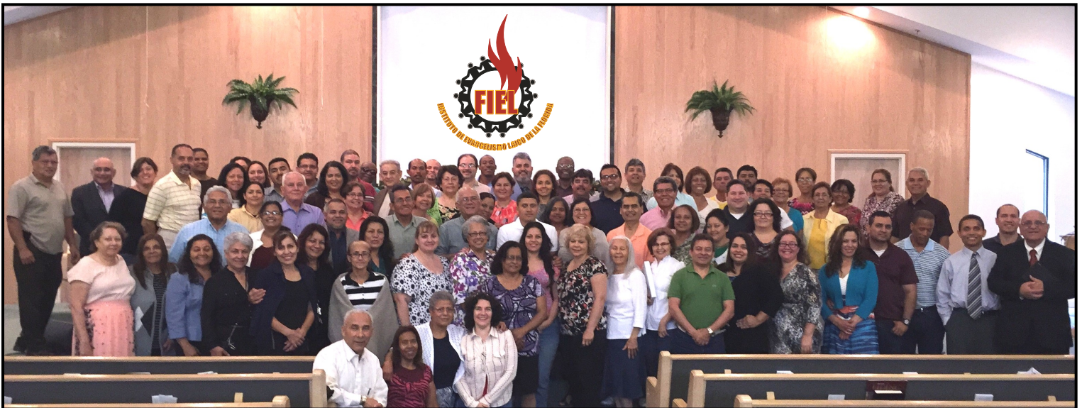
Alumnos del área central que asistieron a la segunda clase del curso 2015 en la iglesia de Winter Park

La clase final, que no está incluida en los créditos oficiales pero que todos aprecian, podría haber recibido el título de “Cómo disfrutar una deliciosa comida con otros líderes adventistas” . El esfuerzo de varios miembros de iglesia se tradujo en una comida abundante, deliciosa y nutritiva. Alabamos a Dios por cada una de las bendiciones recibidas el 12 de abril de 2015 en la clase de FIEL.