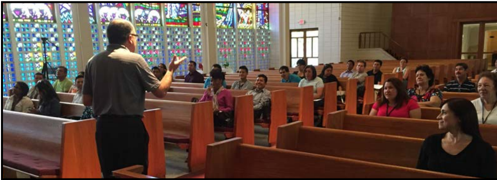
Los alumnos disfrutaron la presentación de la clase de Hermenéutica

llegado de diferentes lugares, incluyendo a cuatro que viajaron desde Melbourne y Vero Beach. Las clases presentadas en este trimestre han creado las bases para las próximas que tendrán más de práctica que de teoría. Cada alumno del instituto participará de la investigación directa de textos difíciles de comprender. Es pues necesario que cada uno traiga su propia Biblia. ☺☺