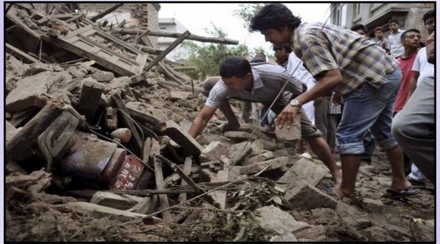
Escena del terremoto en Nepal

Al prepararnos en nuestro instituto, lo hacemos, no solo para adquirir conocimiento de la verdad bíblica sino para compartirlo con los demás. Cada día perecen miles de personas sin estar listas para el encuentro con Dios. Es nuestra urgente misión informar al mundo acerca del plan de la redención. Debemos hablarles que hay vida en Jesús; que es necesario que se entreguen a él antes que sea de-