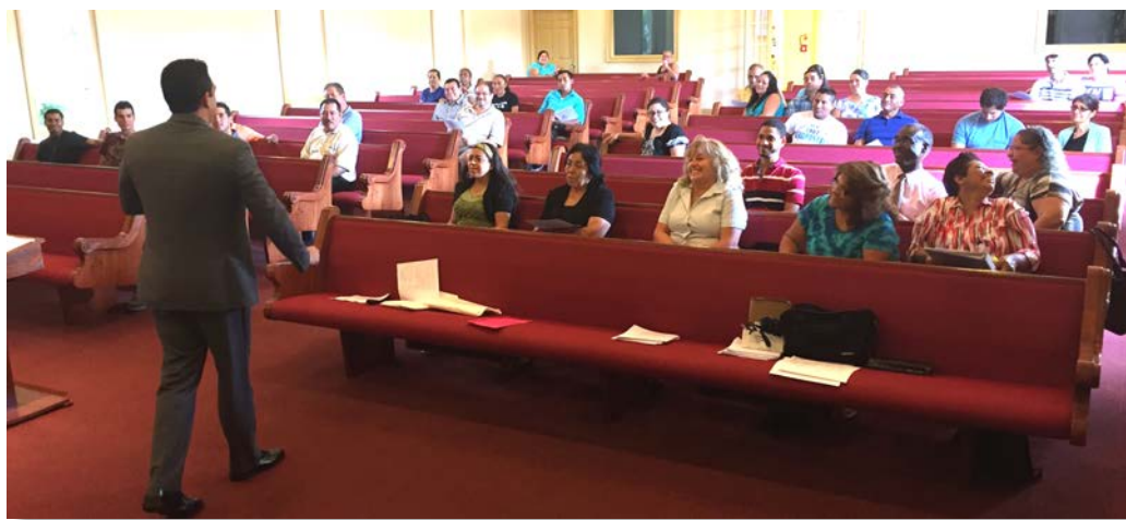
Alumnos en Fort Myers reciben felices la clase de “Métodos de Evangelismo”

El perdón no es licencia para seguir pecando. Como pecadores, que todos lo somos, podemos caer en faltas y clamar por el perdón. Éste llegará de inmediato cuando, de corazón sincero nos arrepentimos. Pero el principal síntoma del arrepentimiento es una sincera determinación de abandonar el pecado por la gracia y el poder de Dios. Algunos han persistido en el pecado para que la gracia abunde. Pablo es claro al decir: “En ninguna manera” (Rom. 6:1) . Algunos pecadores han persistido temerariamente en su error. El apóstol de los gentiles se encontró con un caso tal en la iglesia de Corinto y tuvo que tomar medidas fuertes con él. Había creado un escándalo al convivir ilegalmente con la esposa ¡de su propio padre! Pablo parece ser fuerte cuando lo condena, pero a veces las medidas deben ser firmes en bien de la iglesia. No obstante, más tarde Pablo mismo llama a la iglesia a tener misericordia con el pecador cuando decidió venir a los pies