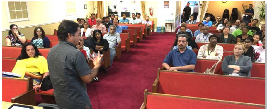
En Brandon todos recibieron jubilosos la enseñanza de sus profesores

indirecto: El mismo autor y en la misma carta nos dice, un poco más adelante (Colosenses 2:8, 9) que en Cristo “habita corporalmente la plenitud de la Deidad” . Si él es divino, Dios, no pudo ser creado; por el contrario, él es el Creador de todas las cosas y todo lo merece.