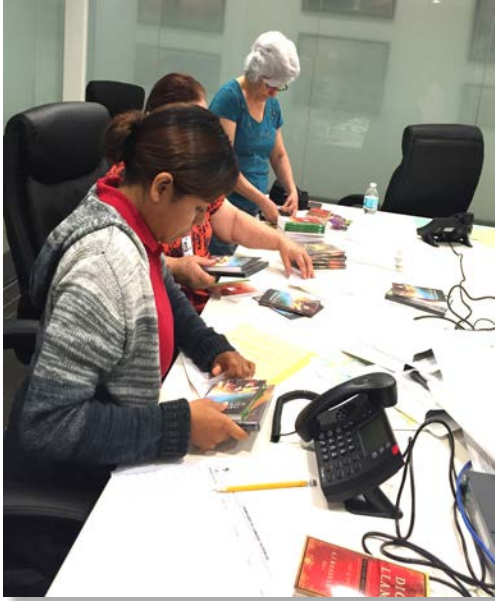
Alumnas de FIEL contestando las llamadas del programa REVELACIÓN

Parece que fue ayer cuando aquel domingo 21 de abril del 2002, nos sentamos ante los micrófonos en la cabina de la emisora “La Poderosa” (670 AM),