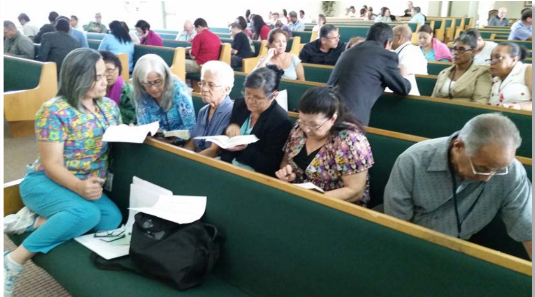
Grupos de investigación dinámica en la clase en Carol City, área Sur.

Sin lugar a dudas, el programa de radio REVELACIÓN es una poderosa herramienta disponible. Alumnos del área central están dando una valiosa ayuda al contestar las llamadas telefónicas de los radioyentes que solicitan los obsequios ofreci-